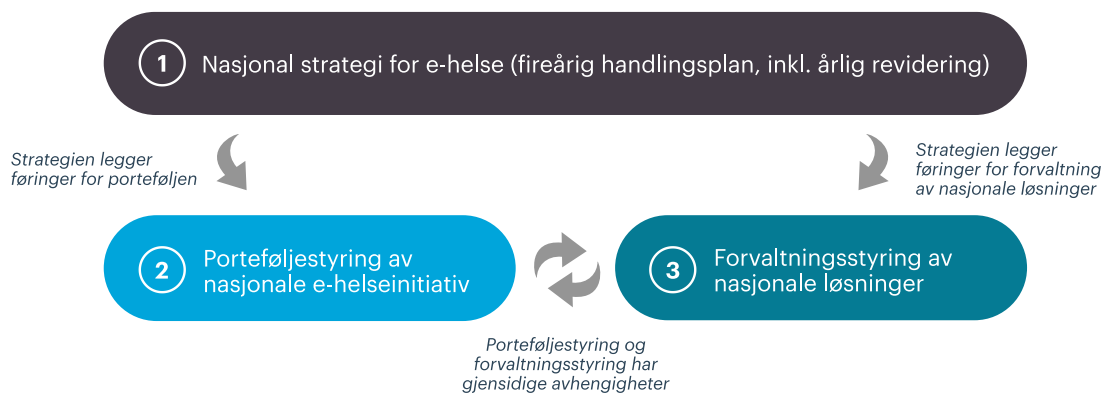
Figur 1 Nasjonale prosesser

Strategiprosessen er en av tre nasjonale prosesser i styringsmodellen, jf. figuren under. Porteføljestyling og forvaltningsstyring understøtter strategiprosessen og vil gi viktige bidrag til oppfølging av strategien og den årlige revideringen av denne.