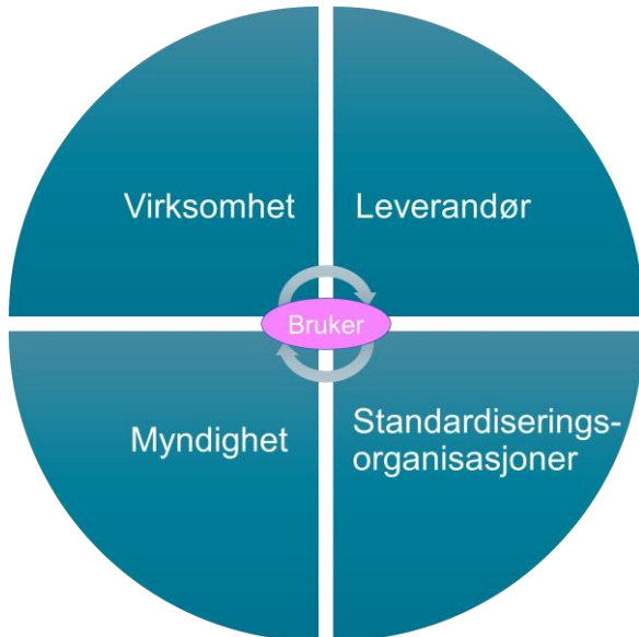
Figur 1 Oversikt over aktørgrupper

Modellen tar utgangspunkt i et aktørbilde med fire grupper som vist i Figur 1. I tillegg er brukere fremhevet som en særlig interessegruppe i modellen. Med brukere mener vi både helsepersonell og innbyggere.