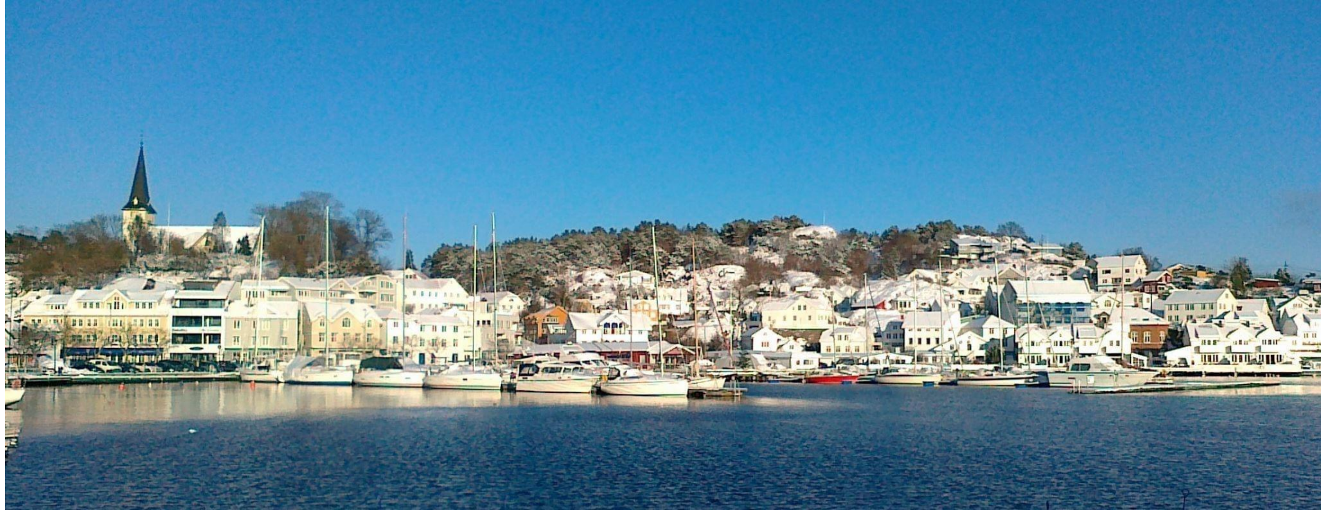
Grimstad havn.