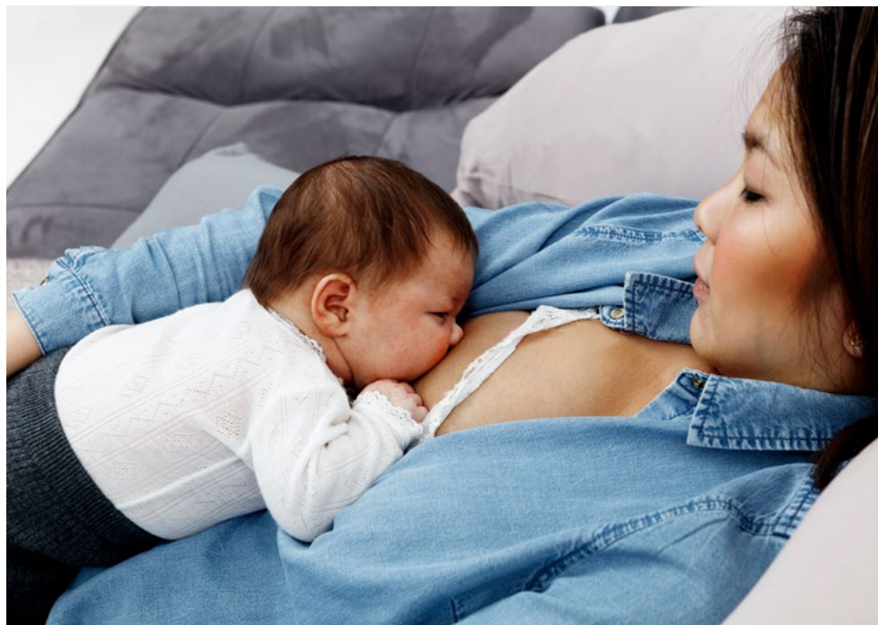
Tilbakeleent ammestilling: Len deg tilbake med barnet oppå deg, mage mot mage.