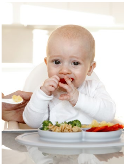
La barnet delta aktivt i måltidet.