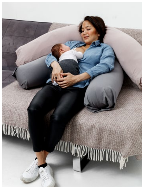
Dette stimulerer barnets ammereflekser.