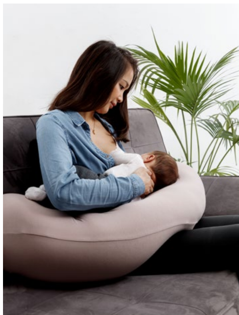
Modifisert vuggestilling: Støtt barnets rygg.