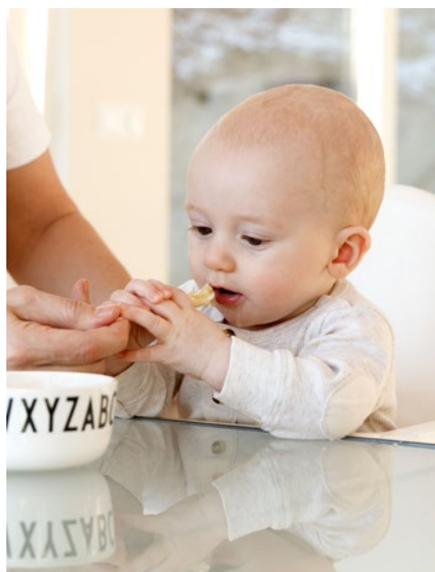
Barnet kan gripe maten og føre den til munnen.