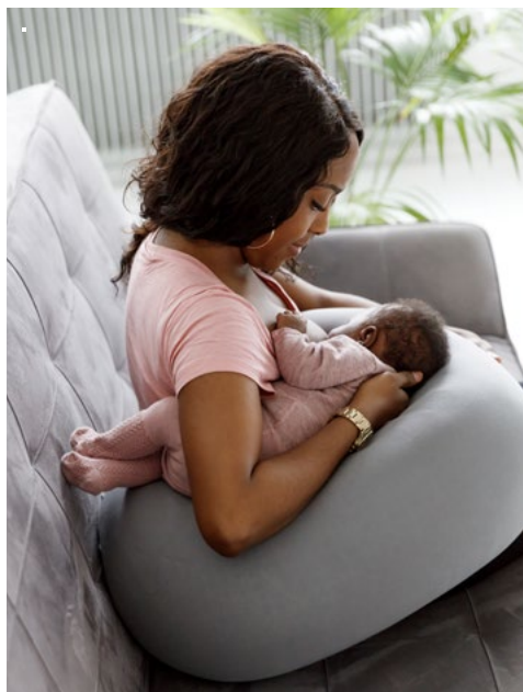
Twillingstilling: Barnet på siden under armen.