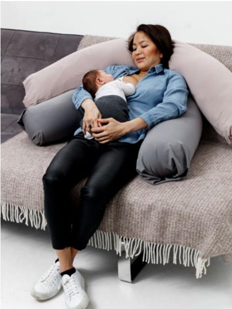
اس طرح بچے کا دودھ پینے کا ریفلیکس شروع ہو جاتا ہے۔