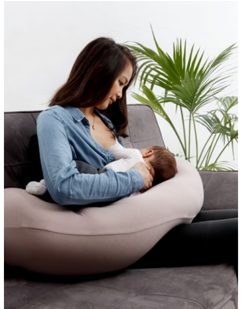
گود میں لے کر دودھ پلانے کا ایک اور انداز: بچے کی کمر کو سہارا دیں۔