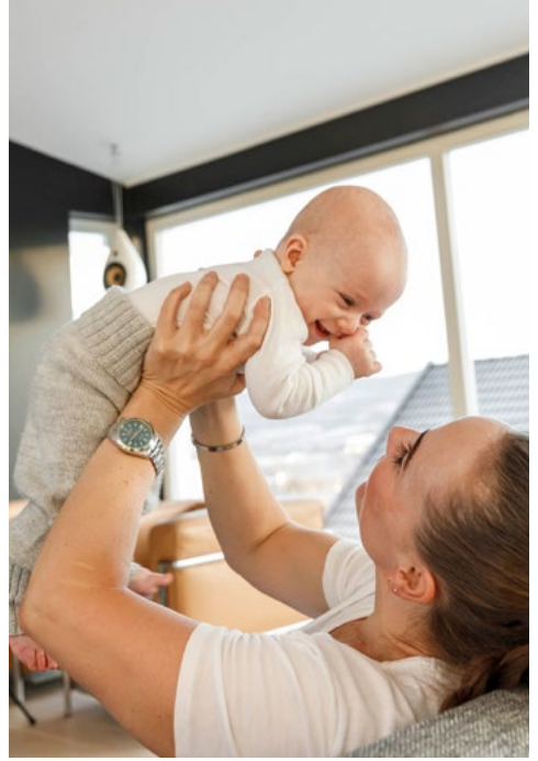
قریب اور نظر ملانے سے ماں اور بچے میں لگاؤ بڑھتا ہے۔