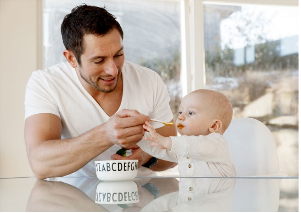
بچہ بیٹھ کر آگے بڑھ سکتا ہے۔