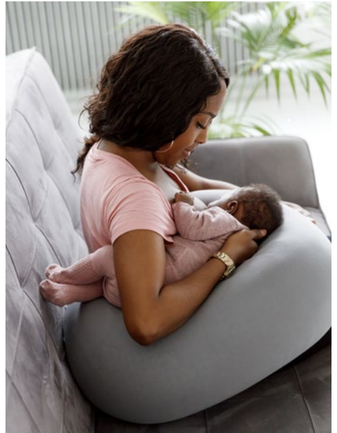
دو بچوں کو ایک ساتھ دودھ پلانے کا انداز: بازو کے نیچے ایک پہلو پر بچہ۔