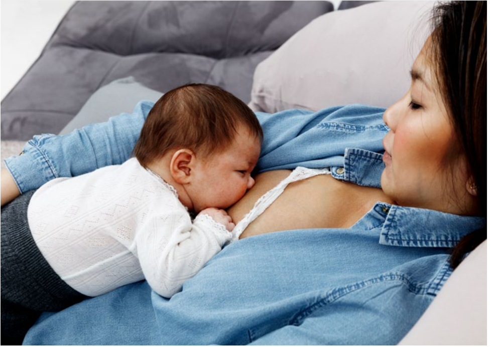
بیچھے سہارا لیے ہوئے دودھ پلانا: بیچھے سہارے پر ٹک جائیں اور بچے کو اس طرح اپنے اوپر ڈال لیں کہ پیٹ سے پیٹ ملا ہو۔