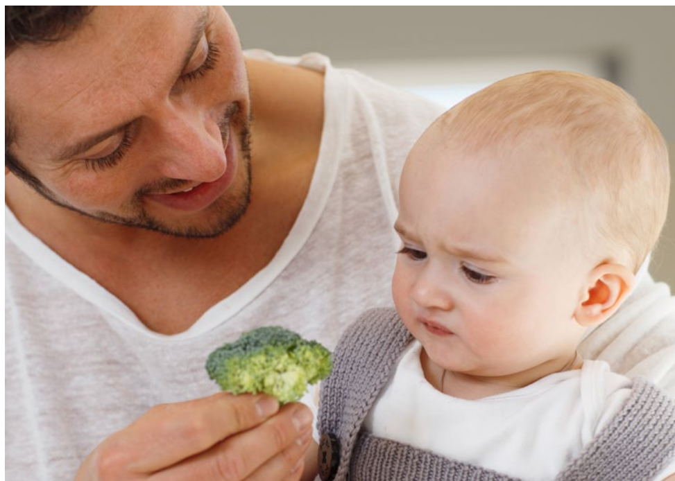
Divtte máná geavahit buot áiccuid: Geahččat – dovdat – máistit.