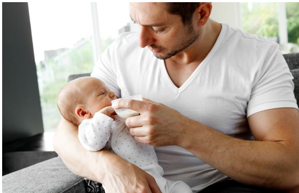
Gohpuin addit mielkki lea buorre molssaeaktu doahttohttalii dassá njamaheapmi lea bures bohtán johtui.