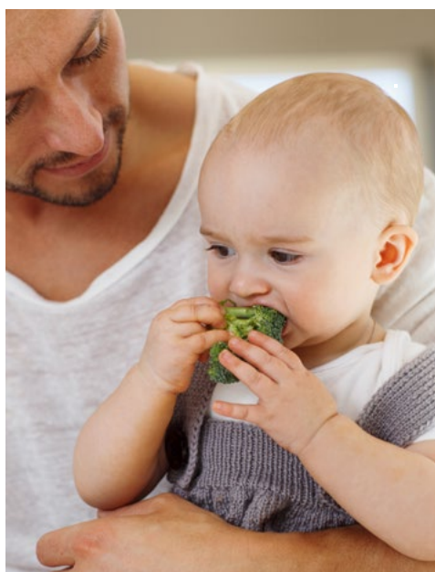
Fála mánnái iešguđetlágan biepmuid ja fála dáid biepmuid mángii.