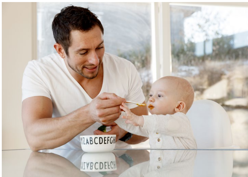
Mánná máhtá čohkkát ja ovddasguvlui luoitit iežas.