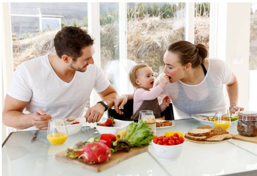
Dearvalaš ja mánggabealat borramuš lea buorre sihke eadnái ja mánnái njamahanáigoda.