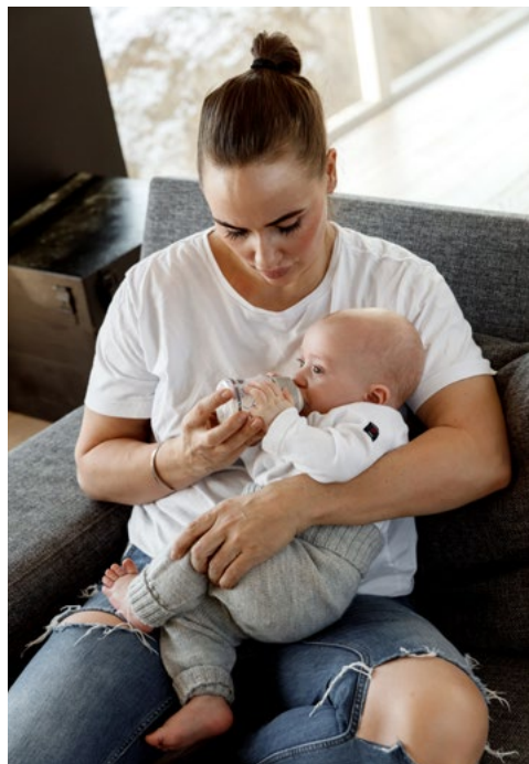
Go bohtal lea veallut de beassá mánná stivret man ollu mielkki váldá.