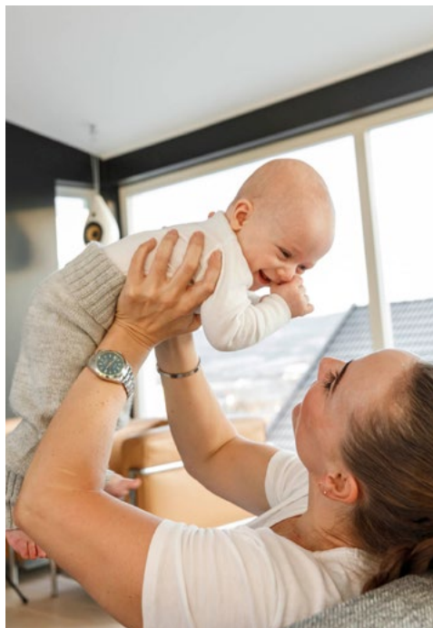
Lagašvuotta ja čalbmeoktavuohta dagaha čatnasumi.