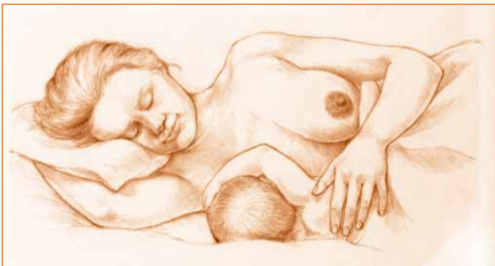
Den liggende stillingen

Dersom du har født ved keisersnitt eller har smerter i bekkenet, foreslår vi at du ammer liggende på siden. I stedet for å snu deg for å bytte bryst, hever og senker du barnet i forhold til øverste og nederste bryst ved hjelp av en stor, litt hard pute. Be gjerne om hjelp i begynnelsen. Du kan også på Internett se Ammehjelpens minivideo om ammestillinger.