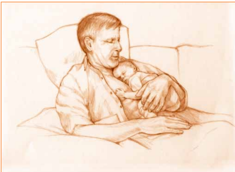
Barnet trenger trygghet og kjærlighet – ligger hud-mot-hud hos mor eller far

Særlig de første ukene har spedbarnet behov for å tilbringe mye av sin tid i foreldrenes armer. Det trenger kroppsvarmen og nærheten deres, slik at overgangen fra tiden inne i morens mage blir så skånsom som mulig. Du selv trenger også omsorg og ro. Skru ned tempoet, og still gjerne lavere krav til både husarbeid og sosialt liv. En trett og anstrengt mor og mas fra omgivelsene kan gjøre både deg og barnet urolige og utilfredse. Ammestundene bør, særlig den første tiden, være hvilepauser for deg også – en mulighet til å legge seg nedpå med god samvittighet. Barnet trenger trygghet og kjærlighet – ligger hud-mot-hud hos foreldrene.