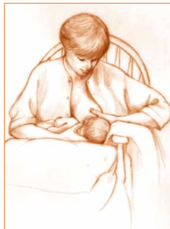
Sittende 2: Mor støtter barnets rygg og nakke med sin hånd og underarm. Barnets nakke skal kun støttes forsiktig, ikke presses mot mor. På den måten kan moren raskt trekke barnet mot seg når det gaper. Samtidig kan moren støtte og eventuelt forme brystet med den andre hånden. Denne stillingen er gunstig ved amming av sugesvake og premature barn, ved store bryst for å gi støtte, eller når det er behov for å forme brystet slik at det passer bedre til barnets gap.