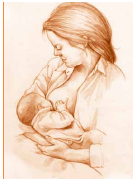
Sittende 1: Den klassiske ammestillingen hvor barnet hviler i morens arm og de har front mot front.