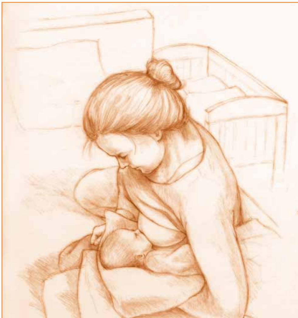
Stilling for nattamming

Stell og bleieskift tar du bare hvis det trengs. Noen barn sover natten gjennom allerede tidlig, andre våkner hver natt, uansett om de får morsmelk eller ikke. Har barnet en tilfredsstillende vektøkning, kan du godt la det sove natten igjennom. Hvis du en periode har litt lite melk eller barnet ikke legger på seg, bør du amme ofte og gjerne legge inn et nattmåltid eller to. Blir du selv sliten og synes det tar på med nattevåking og mye nattmating, så prøv å sove litt du også når barnet sover om dagen.